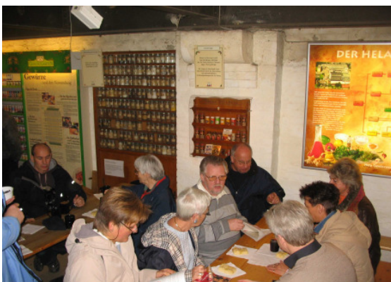
Im Gewürzmuseum: Pause bei Kaffee und Kuchen

Wer sich selbst einmal über das Zoll- und Gewürzmuseum Informieren möchte hier die Web - Adressen